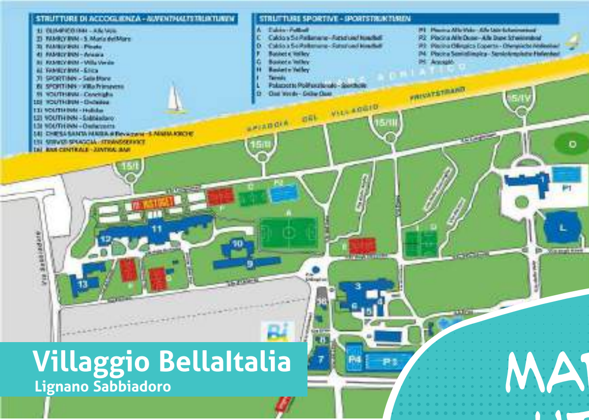
Villaggio BellItalia Lignano Sabbiadoro