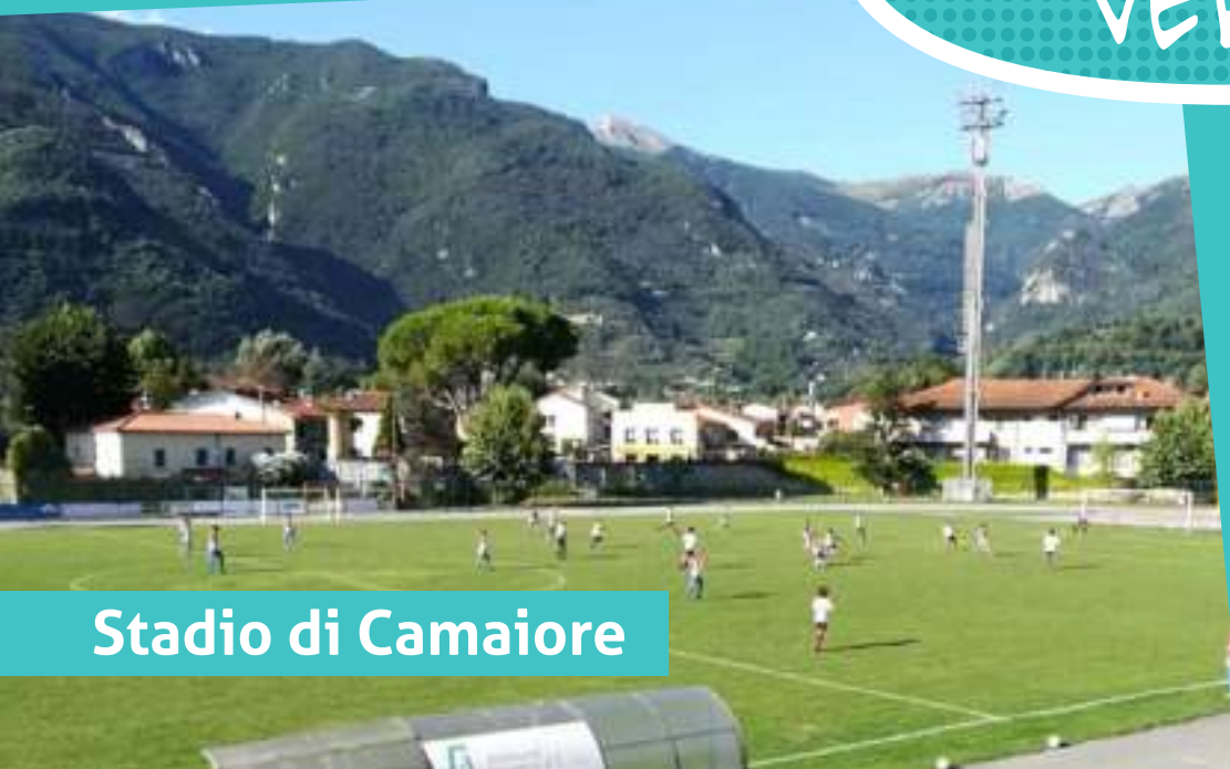
Stadio di Camaiore