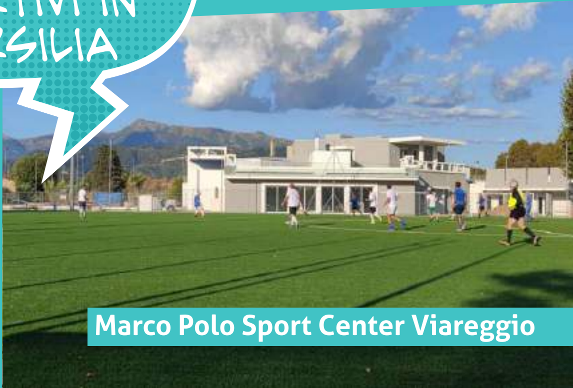
Marco Polo Sport Center Viareggio