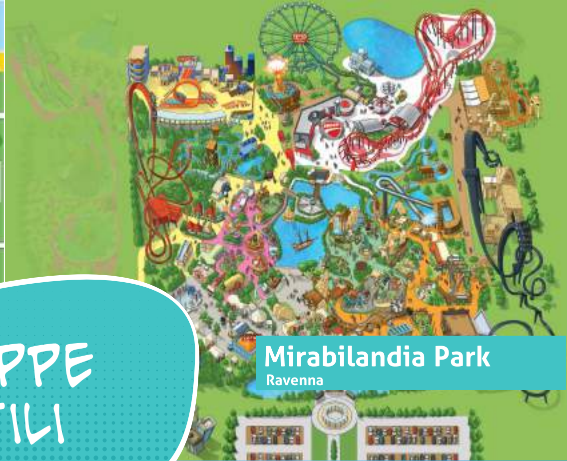
Mirabilandia Park Ravenna