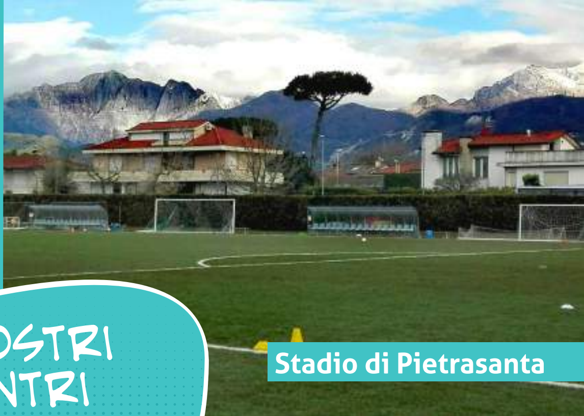
Stadio di Pietrasanta