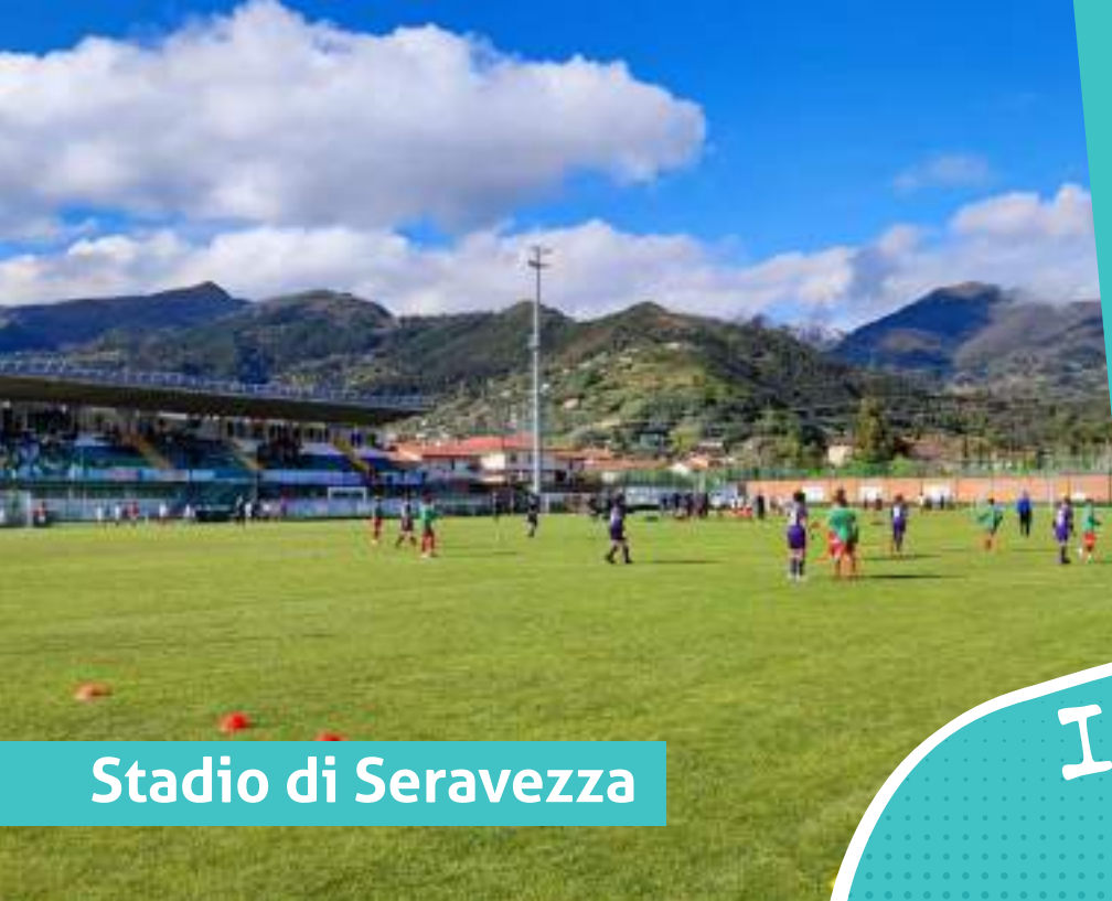
Stadio di Seravezza