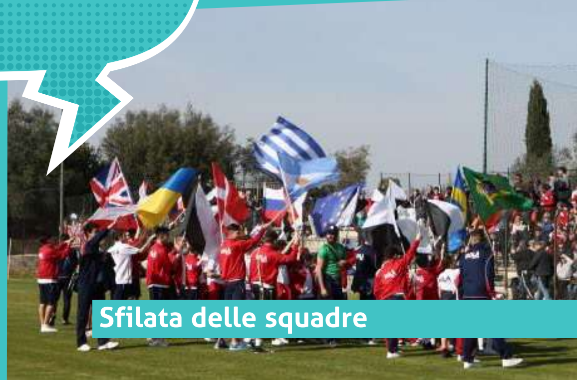
Sfilata delle squadre