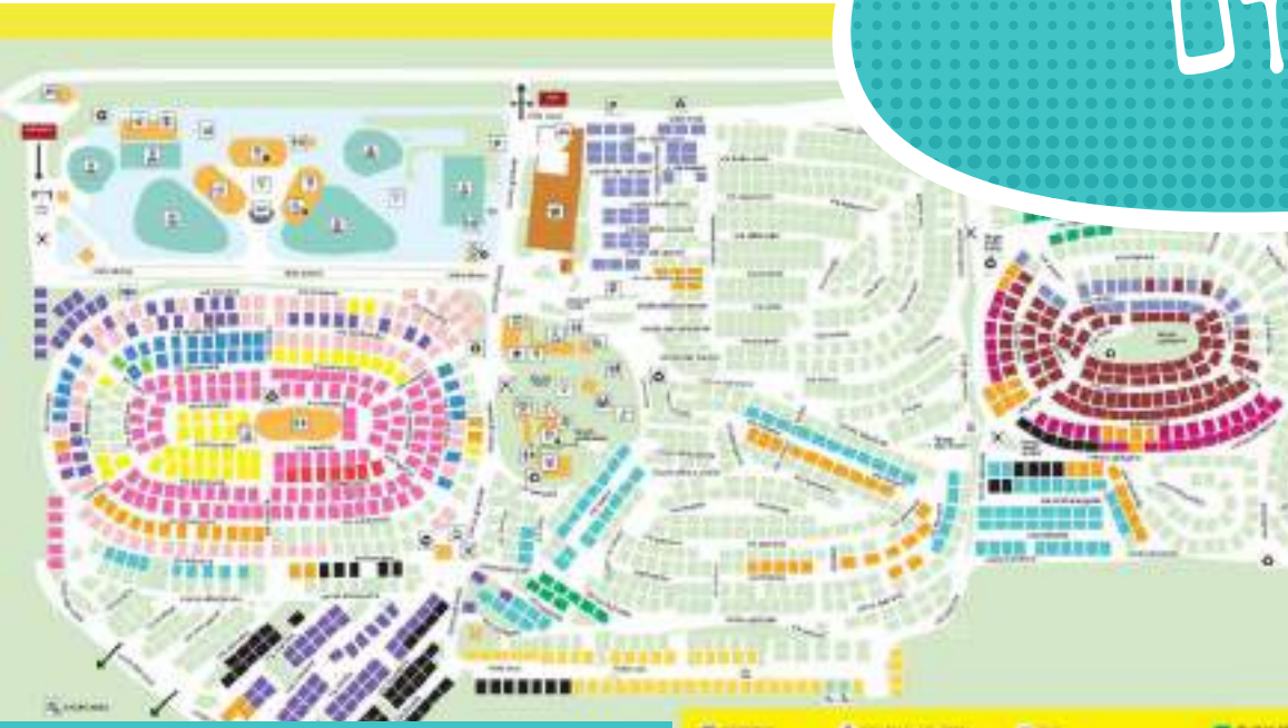
Park Albatros Village San Vincenzo